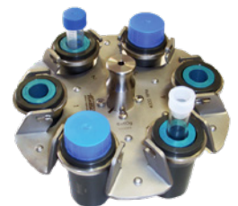
Art.-Nr. 381, teils mit 382